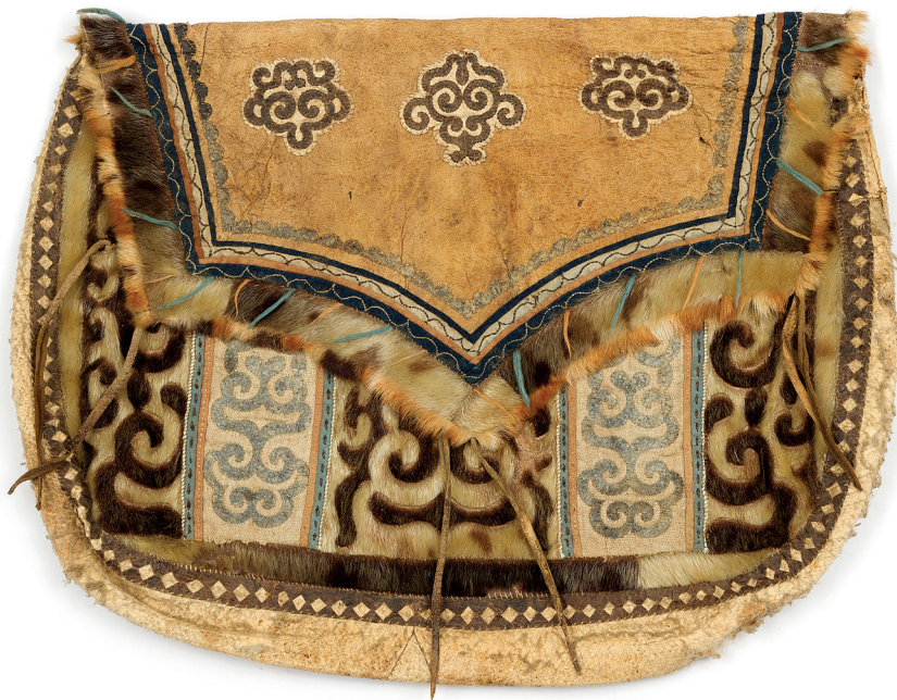
Рис. 10. Женская сумочка из меха нерпы с орнаментом, изображающим шкуру змеи (символ космоса) и голову дракона в центре клапана из ровдуги и двух медведей по бокам. Аппликация, меховая мозаика. Начало XX в., о. Сахалин. Ороки [РЭМ. Кол. 2011-176]

Важное место в орнаменте ороков занимают образы пресмыкающихся (змея, дракона) , взаимосочетающиеся по символике как космические и соллярные. На женских сумках и оленьих луках ороков часто изображались дугообразные полосы с ромбами в центре [РЭМ. Кол. 2011-176, 181; 8761-11443], имитирующие шкуру змеи и выступающие в качестве символа небесного змея-радуги (рис. 10). Интересно, что в шаманском ритуальном комплексе нанайцев и негидальцев также имелись изображения двуглавого змея в виде радуги. Параллели уводят на юг и север. Подобный образ был известен в древнем Китае и у индейцев Центральной Америки. Образ «радужного змея» характерен для верований австралийцев [8, с. 503—515; 23, с. 31; 44, с. 61, 129, рис. 30]. Аналогичные круговые изображения имеются на шаманских бубнах эвенков [РЭМ. Кол. 5589-41; 11, с. 165—175], шаманском халате нанайцев [РЭМ. Кол. 11406-1] и плетёных тарелках ульчей