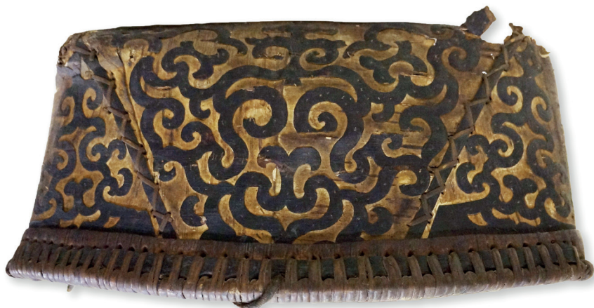
Рис. 11. Орнамент на берестяной коробке (вид снизу вверх перевёрнут, смотрят сверху на сумку) с изображением морды дракона и двух древ жизни с богинями на их вершинах по бокам. Начало XX в., о. Сахалин. Ороки [РЭМ. Кол. 2011-116]

Наряду со змеей у ороков на берестяных коробках имеются изображения голов драконов , несущих фигуры женщин-прародительниц, что иллюстрирует тотемистический миф о браке женщины и дракона (рис. 11)