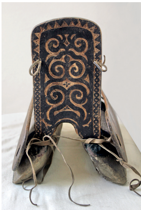
Рис. 1. Оленье седло с деревянной лукой, орнаментированное черчением, изображающим двух птиц, трёх змей и богиню плодородия. Конец XIX — начало XX в., о. Сахалин. Ороки [РЭМ. Кол. 8761-11443]