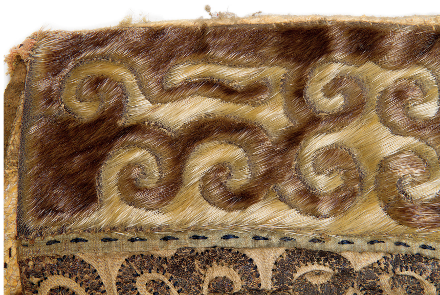
Рис. 5. Изображение рогатого тигра на женской сумочке из меха нерпы, меховая мозаика. Конец XIX — начало XX в., о. Сахалин. Ороки [РЭМ. Кол. 8762-18260]

неолита-бронзы, где сочетались северные и южные традиции [28, с. 260, 264], и уже оттуда, вероятно, они перешли в Восточную Азию. Отметим, что и у других тунгусо-маньчжуров (нанайцев, эвенков, удэгейцев, орочей) в шаманстве был распространён образ тигра как духа-покровителя [РЭМ. Кол. 1870-47; Фотокол. 5654-213а; 18, с. 174, 181, 184—185]. Иссле-