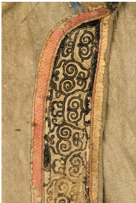
Рис. 4. Орнамент с изображением головы медведя на левой поле женского халата из ровдуги оленя. Вышивка. Середина XX в., о. Сахалин. Ороки [РЭМ. Кол. 6808-15]

Изображается либо распростёртое животное, либо его шкура или голова в криволинейно-спиральном исполнении [РЭМ. Кол. 2011-176; 8761-18260]. На крышках женских берестяных коробок ороков из коллекции Ю.А. и Л.И. Сем середины XX в. встречаются орнаментальные композиции типа розеток с изображением голов медведей по бокам (образ медведя-предка), двух бабочек и зародышей, связанных с культом плодородия и символизирующих жизнь, либо фигуры черепахи и двух змей, как оппозиции неба и земли, либо розетки из четырёх