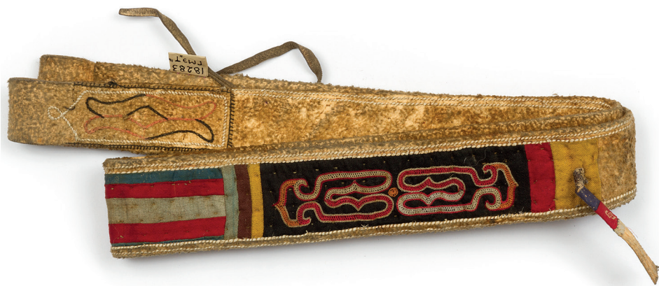
Рис. 9. Голова-челюсти хищника (кабана). Симметричный орнамент на оленьей оброти. Кожа, ткань, вышивка. Конец XIX — начало XX в., о. Сахалин. Ороки [РЭМ. Кол. 8762-18283]

Изображение кабана в орнаменте ороков представляет собой голову с открытой пастью-челюстями, глотающую солнце в образе оленя. Оно вышито нитками на подоле левого края женской одежды, а также на оленьей оброти ороков (рис. 9) [РЭМ. Кол. 8762-182836; 22, с. 195].