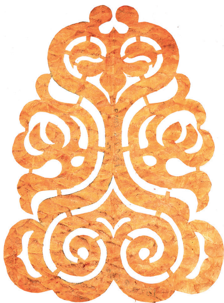
Рис. 12. Образец орнамента из берёсты, изображающего фигуру женщины-прародительницы с двумя птицами по бокам. Конец XIX — начало XX в., о. Сахалин. Ороки [РЭМ. 8762-8248]