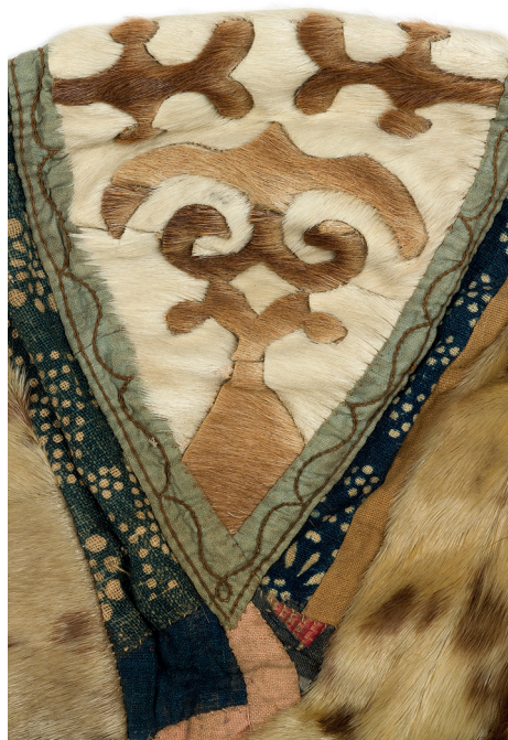
Рис. 3. Изображение орла на капорообразной женской шапке из меха оленя. Начало XX в., о. Сахалин. Ороки [РЭМ. Кол. 2011-68]

Кол. 1661-3]. Подобный тип орнамента в технике меховой мозаики зафиксирован на одежде эвенков Оленека и ульчей, а также на вышивке левополого халата нанайцев [15, с. 213, 187]. Он имеет прямые аналогии в наскальных изображениях Забайкалья (Селемжинская писаница эпохи бронзы [27, с. 68—73, 80]), наследниками которых являлись буряты и эвенки, от последних этот древний тип и мог попасть к орокам.