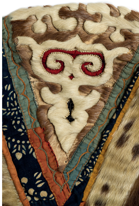
Рис. 2. Изображение филина на женской капорообразной шапке из меха оленя. Конец XIX — начало XX в., о. Сахалин. Ороки [РЭМ. Кол. 8762-18201]

халата из ровдуги оленя [РЭМ. Кол. 6808-15], а также на женском головном уборе [РЭМ. Кол. 6781-18201] (рис. 2). Параллели можно обнаружить в Амурско-Сахалинском регионе. У орочей и удэгейцев филин и сова считались охранителями детей и изображались в виде деревянных амулетов [РЭМ. Кол. 8761-9753 а, б]. В мифологии айнов помощник первопредка, воспринимавшийся как покровитель деревни [35, с. 206], и его сестра имели образы филина и совы. Именно для айнов этот тип представлений являлся наиболее популярным. Орокские изображения филина, по-видимому, также связаны с образом духа-покровителя и были заимствованы у айнов Сахалина, как и изображения орочей и удэгейцев. В шаманизме удэгейцев и эвенков образ филина в качестве духа-покровителя [РЭМ. Кол. 1879-46; 1985-36 а] присутствует как архаичный реликт, относящийся к периоду тунгусо-айнского взаимодействия во время пребывания тунгусов на Амуре или в Приморье, т.е. в период илоу.