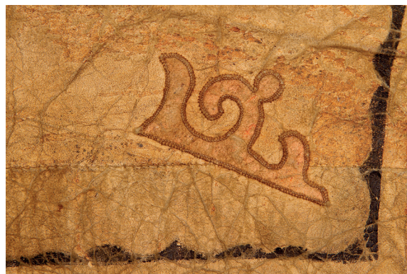
Рис. 6. Орнамент с изображением всадника на волке (шаманский образ), аппликация по ровдуге. Начало XX в., о. Сахалин. Ороки [РЭМ. Кол. 2011-179]

неолита-бронзы, где сочетались северные и южные традиции [28, с. 260, 264], и уже оттуда, вероятно, они перешли в Восточную Азию. Отметим, что и у других тунгусо-маньчжуров (нанайцев, эвенков, удэгейцев, орочей) в шаманстве был распространён образ тигра как духа-покровителя [РЭМ. Кол. 1870-47; Фотокол. 5654-213а; 18, с. 174, 181, 184—185]. Иссле-