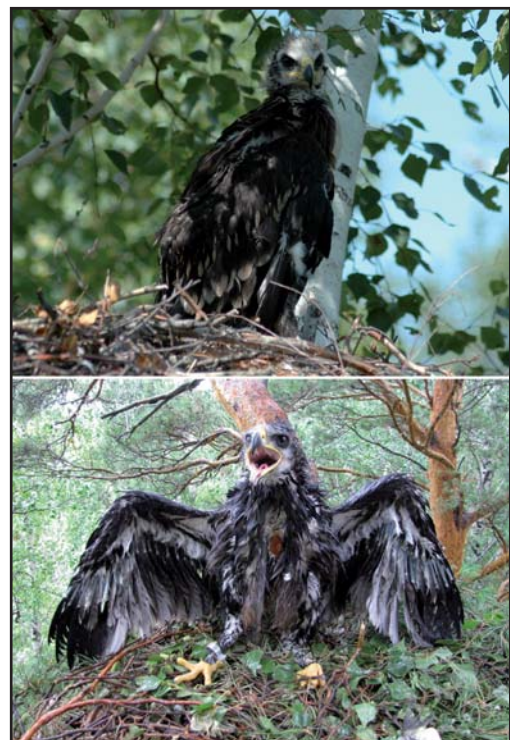
Птенцы большого подорлика в гнёздах 2009 г.

жаться коршун, останки которого, съеденного филином ( Bubo bubo ), были обнаружены прямо под гнездом. Подорлики, видимо, переместились на гнездование вглубь леса на 500–800 м, но их нового гнезда обнаружить не удалось. Тем не менее, в течение пары часов на данном участке посчастливилось наблюдать и самца, и самку с добычей, пролетавших вглубь леса. Перемещение данной пары подорликов дальше от опушки мы связываем с усилившейся конкуренцией с орланом-белохвостом ( Haliaeetus albicilla ), пара которых заняла участок всего в 600 м от старого гнезда подорликов. Возможен также уход подорликов из-за близкого соседства с филином, который ранее гнездил-