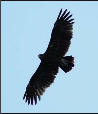
Большой подорлик ( Aquila clanga ).

Greater Spotted Eagle ( Aquila clanga ).