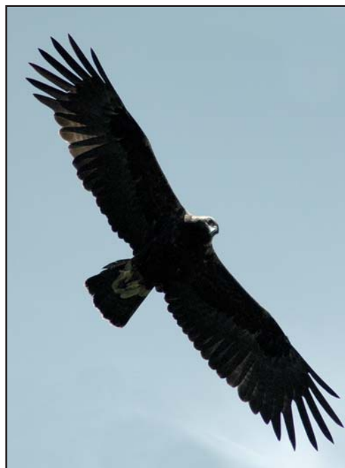
Могильник ( Aquila heliaca ). Imperial Eagle ( Aquila heliaca ).

Учитывая вышеприведенные данные, можно констатировать относительную стабильность гнездовой группировки могильника на исследованной территории: 2 гнездовых участка прекратили своё существование, появились 2 новых и на одном участке держится одинокая птица по причине гибели партнёра на ПО ЛЭП. Длительность существования многолетних гнёзд оказалась невысокой: за пятилетний период отсутствия наблюдений разрушились старые гнёзда на 41,7% гнездовых