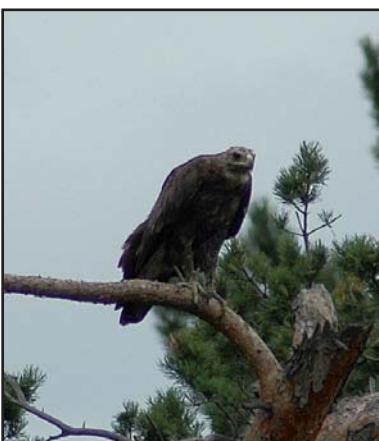
Большой подорлик.

Greater Spotted Eagle.