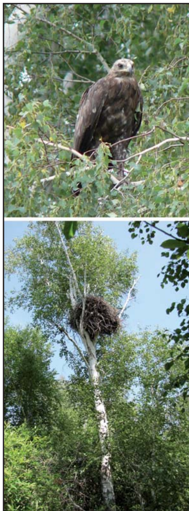
Большой подорлик (вверху) и его гнездо на берёзе (внизу).

Greater Spotted Eagle near the nest (upper) and his nest on a birch (bottom).