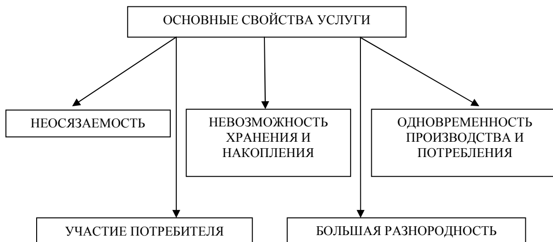
Рис. 1. Основные свойства услуг

Важной особенностью услуги является, ее неосвязаемость, ибо, как правило, услуга не имеет материально-вещественной формы (хотя существуют услуги, оказание которых сопровождается присутствием материально-вещественных объектов, или происходит с помощью таких объектов).