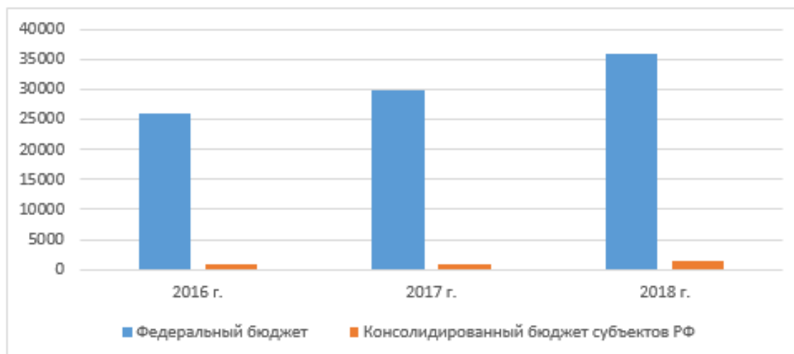
Рис. 1 Сумма административных платежей и сборов по бюджетам за 2016-2018 года., млн руб. [9]

Наблюдается постоянное увеличение платежей и сборов (диаграмма 1). Так, с 2016 по 2018 год увеличение составило больше 10 млрд руб. (с 26,9 млрд руб. в 2016 г. до 37,2 млрд руб. в 2018 г.). На это в большей степени повлияло увеличение тех платежей, которые поступают в федеральный бюджет (их увеличение составило 9,8 млрд руб.), а платежи в пользу консолидированных бюджетов субъектов РФ увеличились на 550 млн руб. При этом темп прироста платежей, приходящихся на консолидированные бюджеты субъектов выше, чем аналогичный показатель у платежей, приходящихся на федеральный бюджет (56% и 37% соответственно).