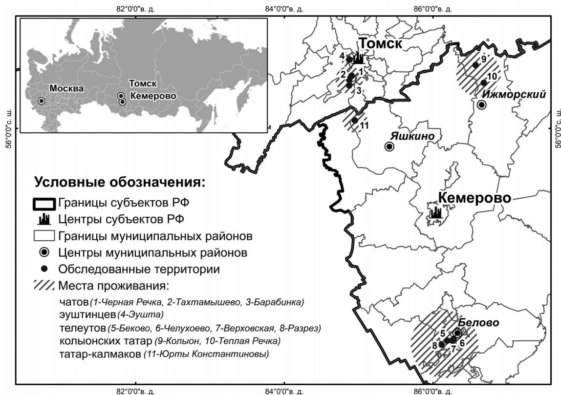
Рисунок 1. Карта обследованных мест компактного проживания томских татар (чатов и эуштинцев), татар-калмаков, бачатских телеутов и колыонских татар в Западной Сибири Figure 1. Map of studied compact settlements of Tomsk Tatars (Chats and Eushtints), Tatars-Kalmaks, Teleuts and Kolyon Tatars in Western Siberia