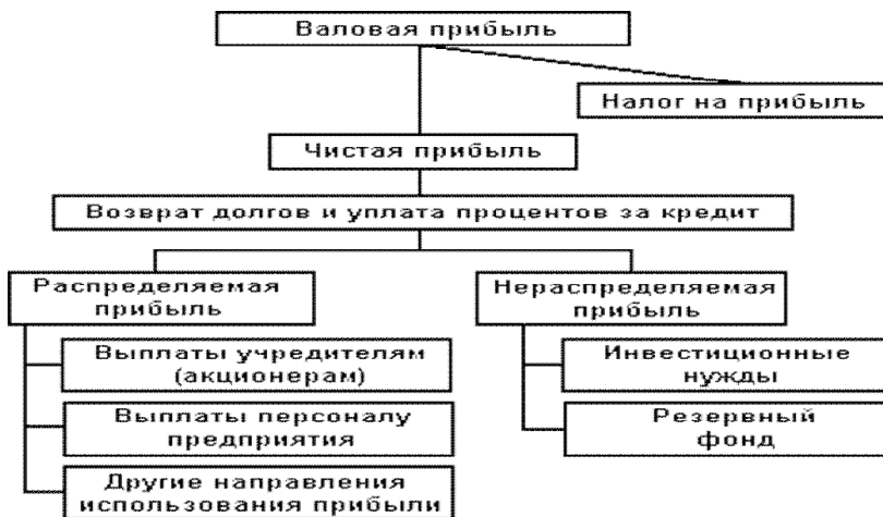
Рисунок 1 - Механизм распределения прибыли.

Механизм распределения прибыли представлен на рисунке 1.