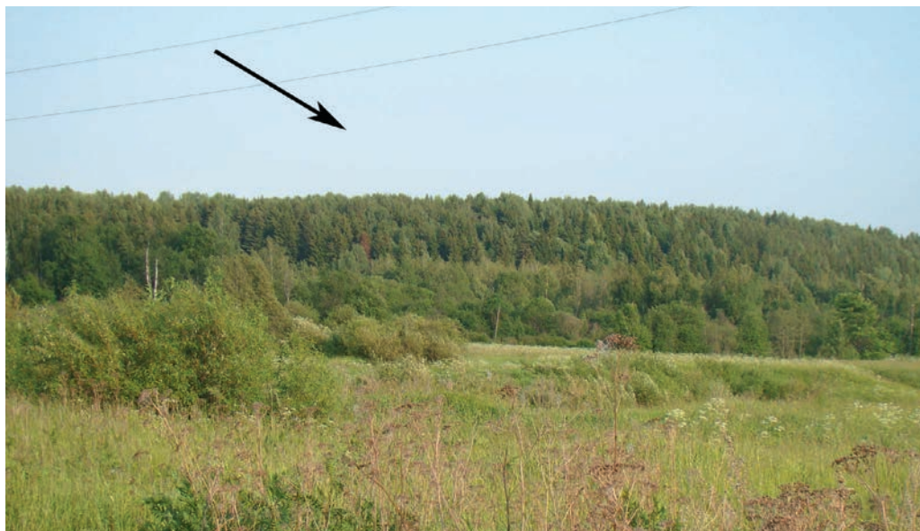
Рис. 2. Вид на предполагаемое место расположения святылища Губервёсь в низовьях Убыти.