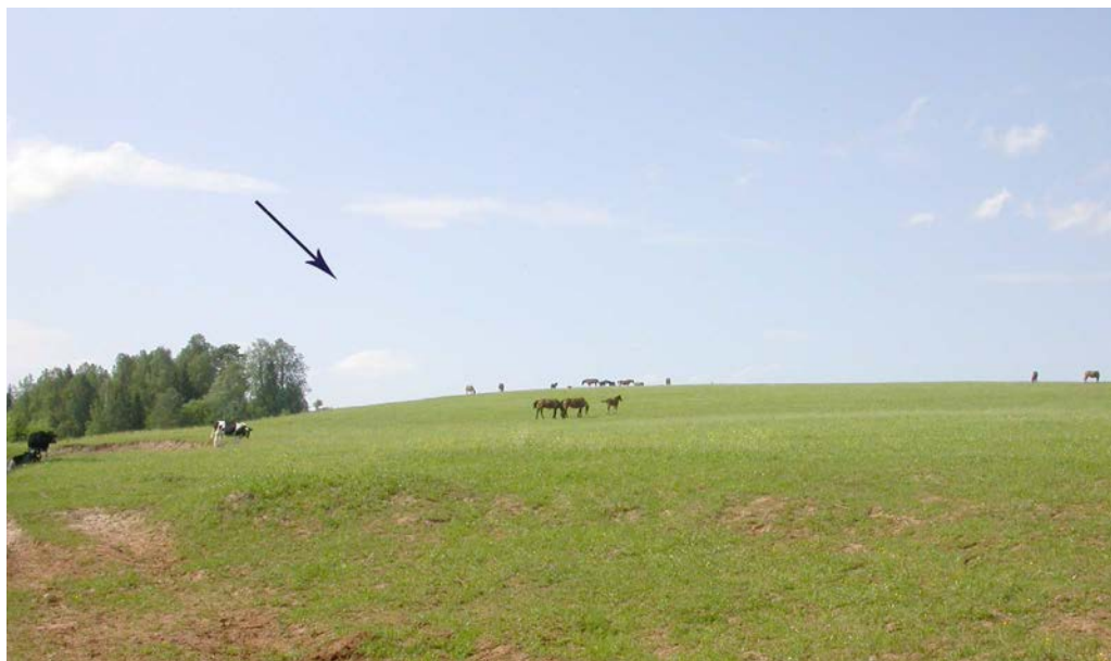
Рис. 4. Вид на предполагаемое место расположения святилища Губервось в верховьях рек Парзи и Убыти.