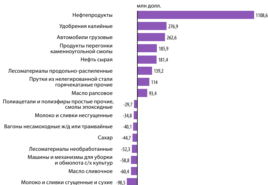
Рис. 7. Наибольший прирост и падение экспорта в разрезе товарных позиций в январе – сентябре 2018 г. по сравнению с январем – сентябрем 2017 г. Источник: [2]

Отрицательная динамика сложилась в экспорте таких белорусских товаров, как (рис. 7) молоко и сливки сгущенные и сухие (за январь – сентябрь 2018 г. по сравнению с аналогичным