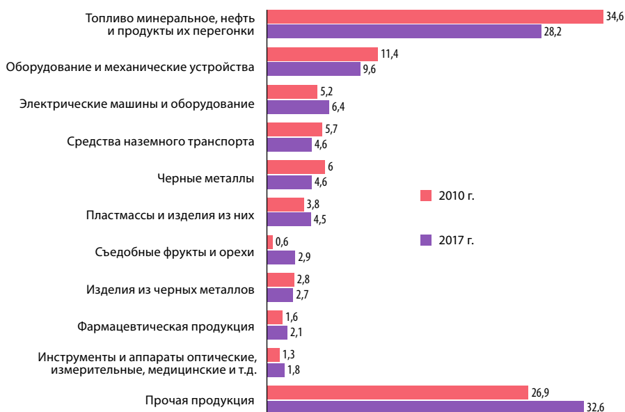
Рис. 6. Структура импорта товаров в Республику Беларусь в 2010 и 2017 гг., %. Источник: [2]

товаров с высокой добавленной стоимостью и степенью переработки невысока.