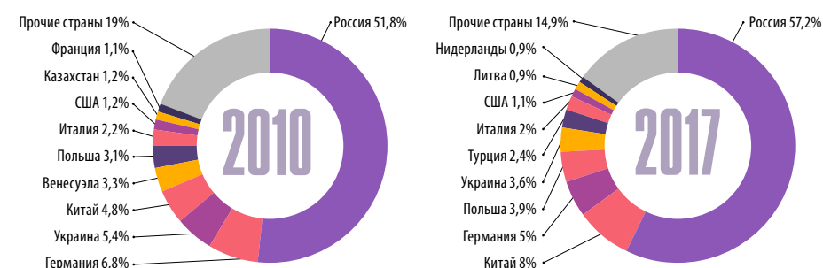
Рис. 2. Географическая структура импорта товаров в Республику Беларусь в 2010 и 2017 гг.