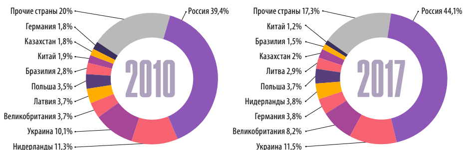
Рис. 1. Географическая структура экспорта товаров Республики Беларусь в 2010 и 2017 гг.

Анализ экспортных позиций товаров Республики Беларусь показывает превалирование рынка России (рис. 1). Причем за последние 7 лет его удельный вес в общей географической структуре экспорта увеличился с 39,4 до 44,1%.