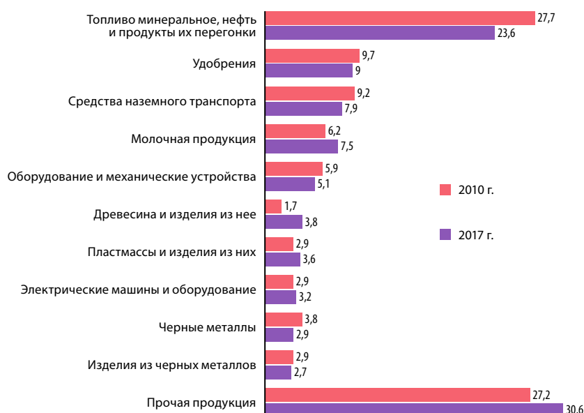
Рис. 5. Структура экспорта товаров Республики Беларусь в 2010 и 2017 гг., %.

Среди причин такого положения можно выделить присоединение России к ВТО, что повлекло снижение таможенно-тарифной защиты Евразийского экономического союза, сокращение платежеспособного спроса в РФ ввиду падения валютных поступлений от экспортируемых энергоресурсов, мировые цены на которые упали как раз в течение исследуемого периода, а также политика, направленная на развитие импортозамещающих производств и их субсидирование государством.