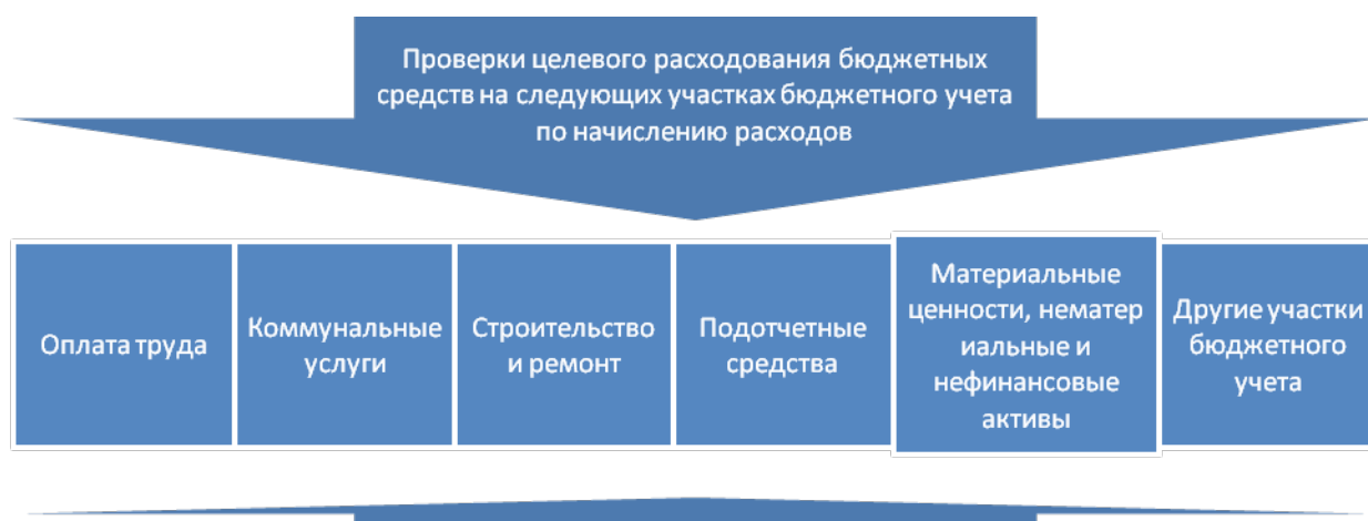
Рисунок 3. Основные этапы технологического процесса проведения диагностики начисленных расходов

Другие способы приемлемы только для конкретных участков бюджетного учета. Например, для того, чтобы выявить случаи использования средств бюджета, выделенных на реконструкцию, строительство объектов, капитальный и текущий ремонты, на цели, не соответствующие условиям их получения, необходимо установить наличие случаев выполнения работ по капитальному строительству и ремонту объектов, не включенных в титульные списки, и (или) при отсутствии проектно-сметной документации; провести контрольные обмеры объемов работ, указанных в актах приемки выполненных работ, с привлечением квалифицированных специалистов, имеющих допуск для выполнения работ по капитальному строительству и ремонту объектов, не включенных в титульный список, и (или) при отсутствии проектно-сметной документации и другие контрольные действия.