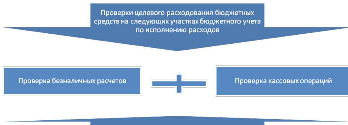
Рисунок 4. Основные этапы технологического процесса проведения диагностики исполненных расходов

расходы, то есть установить реальное нецелевое использование бюджетных средств.