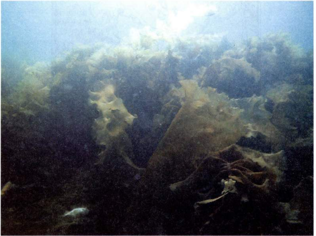
Рис. 3. Монодоминантные заросли L. saccharina в губе Ивановская Figure 3. Monospecific thickets of L. saccharina of Guba Ivanovskaya Inlet