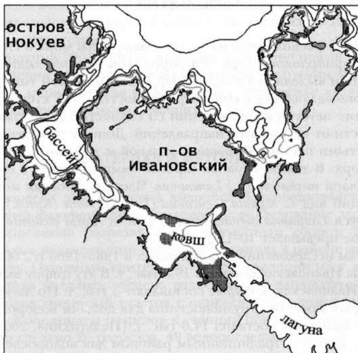
Рис. 1. Районирование губы Ивановская