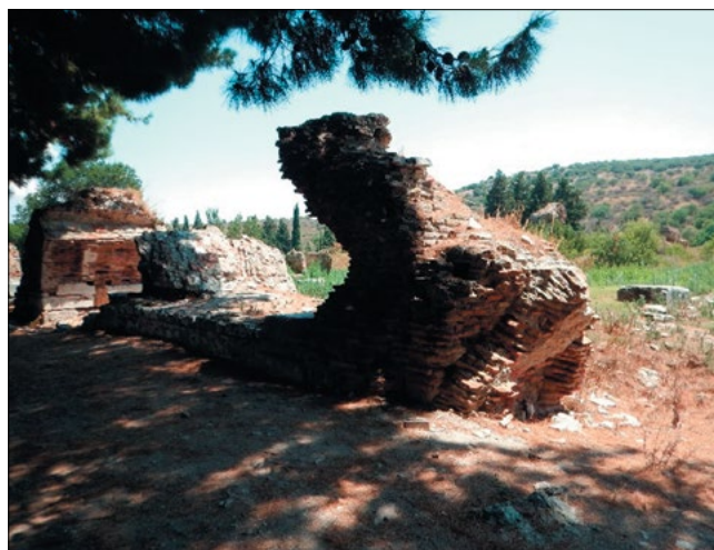
Рис. 3. Место отбора кирпича в историческом комплексе Эфес, Турция. Разрушенная кирпичная кладка возрастом более 1500 лет

Относительно методов оценки морозостойкости — одно дело, когда кирпич максимально насыщается водой и происходит замораживание изделий, другое — когда изделие остается сухим или полусухим в период эксплуатации. Станным является цитирование автором профессора Н.А. Белелюбского, благодаря которому в 1886 г. был принят метод лабораторного определения морозостойкости в холодильных каме-