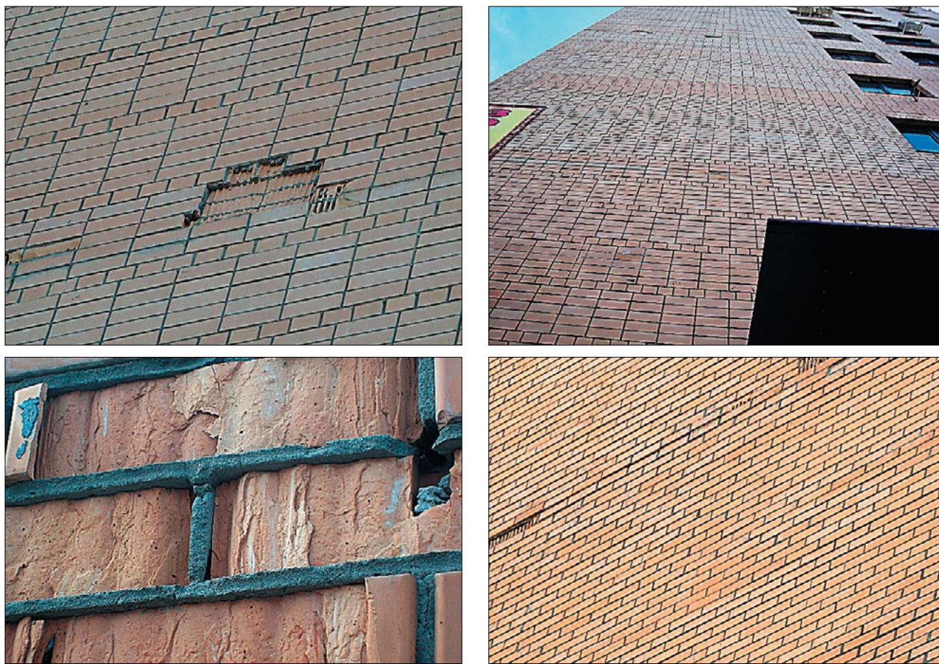
Рис. 4. Примеры разрушения кирпича в многослойной стене многоэтажного жилого дома

Для любого кирпичного завода морозостойкость изделий 600 циклов – гордость и большое достижение, которое хотелось бы подтвердить как в лабораторных условиях, так и в процессе эксплуатации. Поэтому, не подкрепленные дополнительными исследованиями данные не могут быть приняты как доказательство высокого качества изделий.