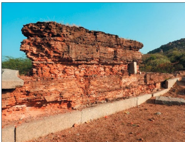
Рис. 2. Место отбора кирпича в индийском штате Карганака. Разрушенная кирпичная кладка возрастом 700 лет

других странах (рис. 2, 3). И если в первоначальных условиях при интенсивной химической коррозии кирпич из «теплых стран» простоял сотни лет, то при испытаниях на морозостойкость изделия разрушались при первых же циклах. В условиях зимы города Ростова-на-Дону, где часты переходы через 0°C, на улице образцы также разрушались достаточно быстро — к весне вместо кирпича на земле оставались лишь осколки. Известно, что керамический кирпич достаточно устойчив к химической коррозии — время тому свидетель, и как результат — огромное количество памятников архитектуры, сохранившихся до наших дней, выполнены из керамического кирпича. Согласно положениям научной литературы по общей или инженерной геологии, где дано описание химического и физического выветривания горных пород, делать вывод, что для нашего климата морозостойкость является второстепенным свойством материалов, весьма смело.