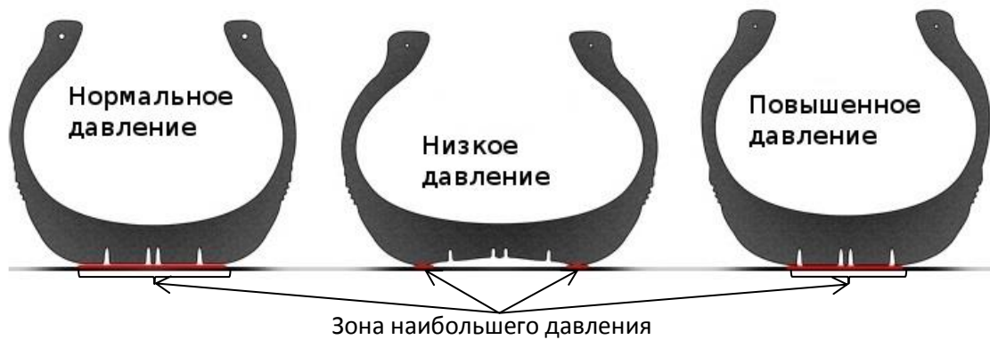
Рис. 1. Пятно контакта шины с поверхностью в зависимости от давления в ней

При нормальном давлении пятно контакта оптимальное, нагрузка в шине распределена равномерно.