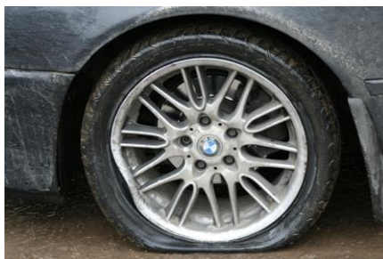
Рис. 3. Колесо автомобиля после попадания в яму с острыми краями на высокой скорости

При повышенном давлении возрастает ударопрочность шины и диска. Каркас шины рассчитан на более чем 10-кратные точечные перегрузки, но он абсолютно не рассчитан на резкий удар, когда острый край ямы сминая шину и с огромным усилием прижимает ее к диску. На малых скоростях защиту колеса оказывает защитный борт, двойной каркас, дополнительный слой резины в боковине. Однако на высокой скорости только высокое давление, которое не дает сомкнуться диску и краю выбоины. Если смыкание произошло, то вероятным последствием будет дыра в боковой поверхности шины и погнутый диск или «шишка» и, возможно, подмятый диск (рис.3).