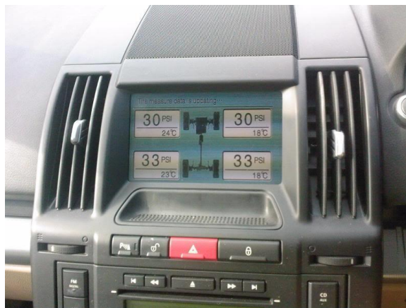
Рис. 5. Дисплей системы контроля давления в шинах

Система прямого измерения давления в шинах состоит из датчиков давления, блока управления, антенны и экрана (дисплея) (рис.5) и работает по принципу измерения давления в каждом колесе.