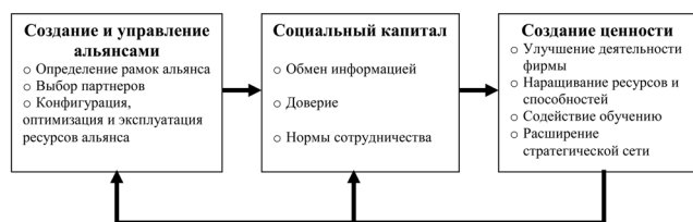
Рис. 1. Создание и управление стратегическим альянсом [24]

Таким образом, инновационные процессы, происходящие в регионе (региональной инновационной системе), могут рассматриваться как результат деятельности подсистем, к которым могут быть отнесены инновационно-территориальные кластеры, промышленные (вертикально и горизонтально интегрированные) кластеры, агломерации, стихийно возникшие возле мегаполисов, и подсистема социально-экономического развития региона. В социально-