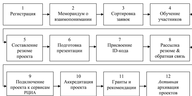
Рис 4. Модель организационных процессов при поступлении заявки от авторов инновационной идеи на вход РЦИА

Этап 2. Заключение меморандума о сотрудничестве компании с РЦИА.