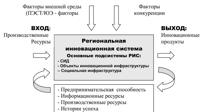
Рис. 3. Основные компоненты обратной связи самоорганизующейся инновационной системы

Далее в ходе развития РИС можно ожидать, что чем больше в ней организовано стартапов, тем чаще будут происходить успешные выходы инвесторов из проектов. Известная эмпирическая статистическая формула, отражающая качество стартапов, гласит, что на десять профинансированных венчурных проектов три проекта провальные, из трех других проектов инвестор возвращает деньги, следующие три проекта можно считать успешными, а последний проект может быть отнесен к очень успешным проектам [8]. Поэтому одним из главных показателей, который мог бы определить эффективность функционирования экосистемы инновационного бизнеса — это ее способность генерировать качественные для инвесторов технологические