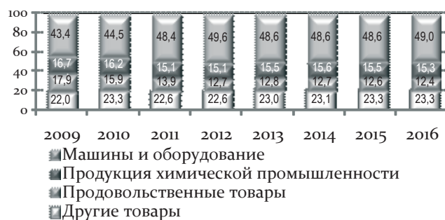
Рис. 4. Изменение товарной структуры импорта РФ в 2009–2016 гг. (по данным таможенной статистики), % к общему объему импорта

Импорт товаров прогнозируется в 2016 г. на уровне 384 млрд долл. (увеличение на 14% по отношению к уровню 2012 г.). В прогнозный период прирост импорта ускорится с 2,9% в 2014 г. до 4,5% в 2016 г., при этом физический прирост импорта также ускорится с 2,1% до 3,8% в год, рост цен ожидается на уровне 0,8% (рис. 4).