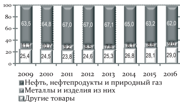
Рис. 3. Изменение товарной структуры экспорта РФ в 2009–2016 гг. (по данным таможенной статистики), % к общему объему экспорта

за баррель в 2014 г. экспорт уменьшится с 511 млрд долл. в 2013 г. до 506 млрд долл. в 2014 г. Товары топливно-энергетической группы за этот период еще более существенно снизят стоимостные объемы экспорта – с 342 млрд долл. в 2013 г. до 328 млрд долл. В 2014–2016 гг. экспорт товаров будет находиться в диапазоне 506–518 млрд долл.