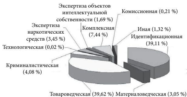
Рис. 1. Структура экспертно-исследовательских работ, выполненных ЦЭКТУ в 2010 г.

заклучений в судебной практике показывает, что при назначении и проведении таможенной экспертизы в рамках таможенного контроля, а также при использовании ее результатов субъектами-участниками всех указанных процессов должна учитываться именно судебная перспектива — т. е. доказательная роль экспертного заключения в суде.