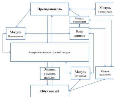
б) Общая модель взаимодействия модулей