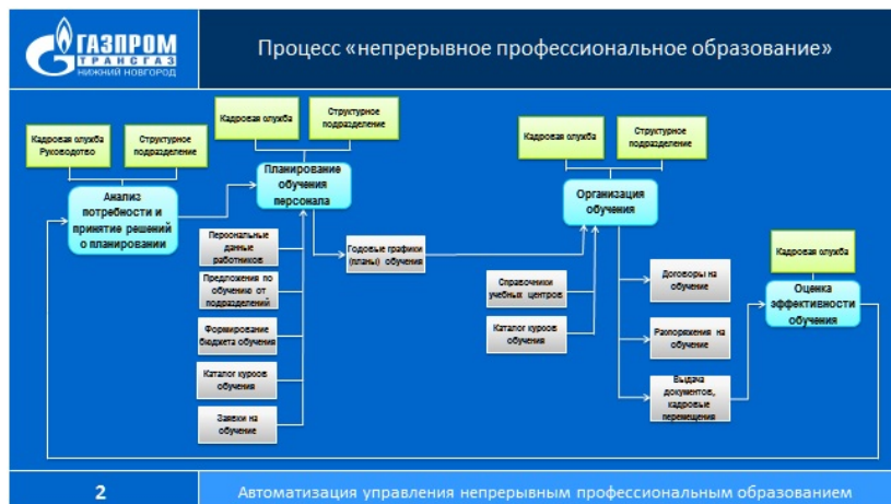
Рис. 2. Система непрерывного образования