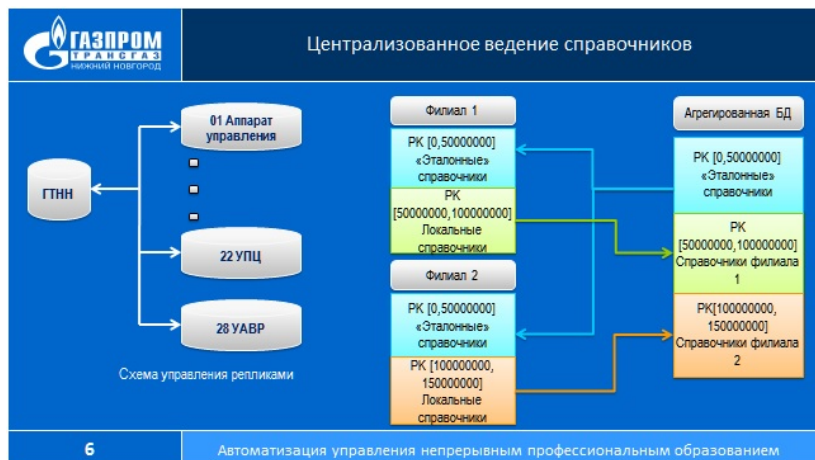
Рис. 3. Централизованное ведение справочников