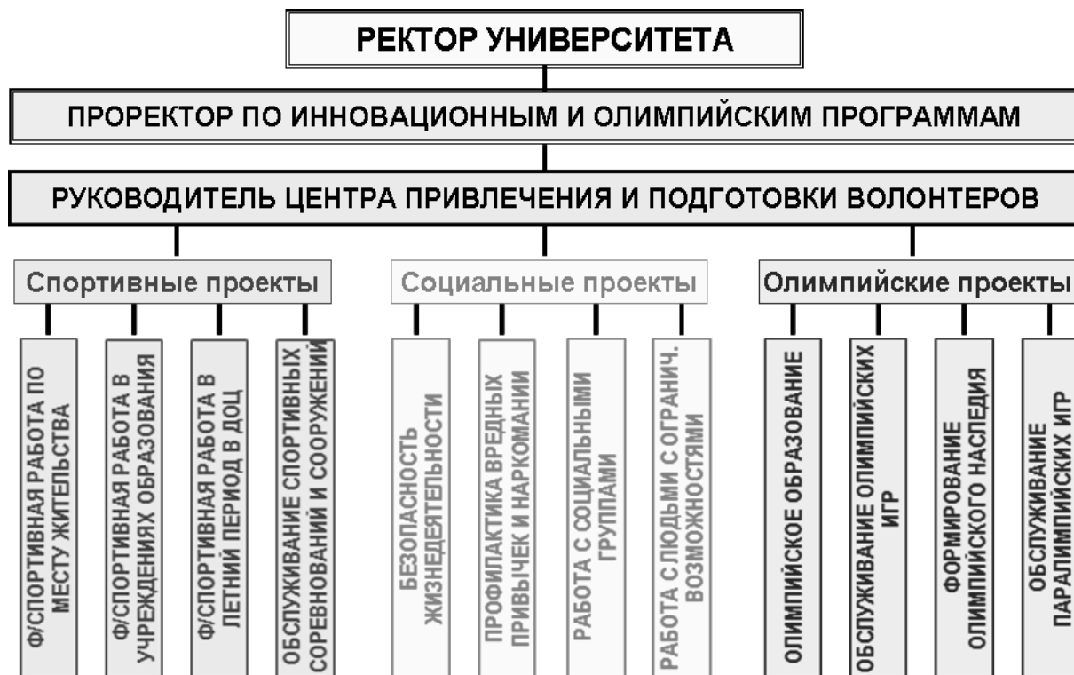
Рис. 3. Структура волонтерского центра КГУФКСТ