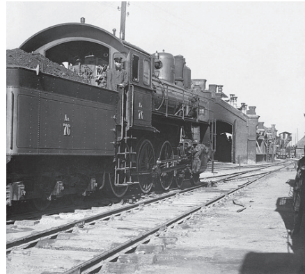
Паровоз перед депо. Между 1905–1915

Фотографу удалось сделать открытие в области светописы, которым заинтересовался Дмитрий Менделеев, организовавший у себя в университетской квартире кружок, а затем и фотографическое общество.