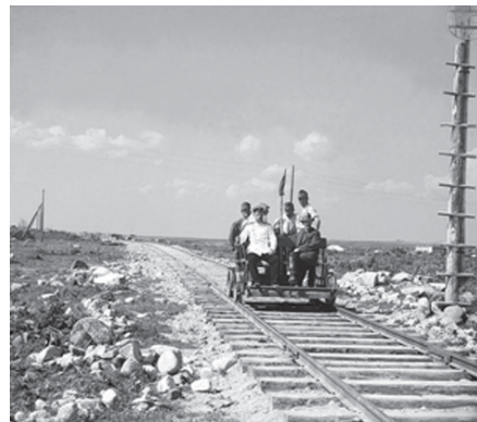
На дрезине недалеко от Петрозаводска на Мурманской ж.д. 1916 г.

Принято считать, что в России того времени было два выдающихся фотографа: Карл Карлович Булла и Сергей Михайлович Прокудин-Горский. Но если первый был фотограф более петербургский, снимавший быт и жизнь столицы, то в поле зрения второго попадала вся Россия. Прокудин-Горский стремился отразить все разнообразие жизни России, ее будни, ее труд, природу, а также жизнь и быт малых народов. Однако он не был единственным в